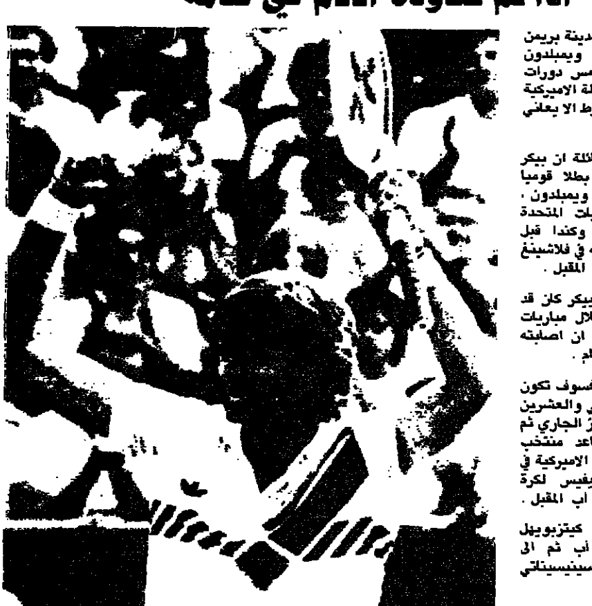
اللاعب الالماني بوريس بيكر (اب - رايو)

تذرت مصادر مطلعة في مدينة برين الامانية الغربية ان بطل ويمبلدون بوريس بيكر قد يلعب خمس ساعات دولية قبل المشاركة في البطولة الامريكى المفتوحة في الشهر المقبل شرط الا يشفى من الآلام بالكامل. واضلقت تلك المصادر قلقة ان بيكر (١٧ عاما) والذي كرس بطلا قويا اقلنا بعد فوزه ببطولة ويمبلدون سيلعب في كل من الولايات المتحدة والنمسا والمكسيك الغربية وكندا قبل المشاركة في بطولة الامريكى في فلاشينغ ميدو اعتبارا من ٢٦ اب المقبل. وتجدر الاشارة الى ان بيكر كان قد تعرض لاصابة بكاحله خلال مباريات بطولة ويمبلدون ولا يبدو ان اصابته قد شملت الى الشفاء التام. اما المباريات المقبلة له سوف تكون في انديانا بوليس بين الثاني والعشرين والثامن والعشرين من تموز الجاري ثم ينتقل الى هامبورغ لمساعدة منتخب بلاده ضد الولايات المتحدة الامريكى في اطار تصفيات كأس اديفيس لكرة المضرب ايام ٢ و ٣ و ٤ اب المقبل. ويعد ذلك ينتقل الى كيتزبويل (النمسا) بين ٥ و ١١ اب ثم الى مونتريال (١٢ - ١٨ اب) وسينسيناتي (١٩ اب الى ٢٥ اب).